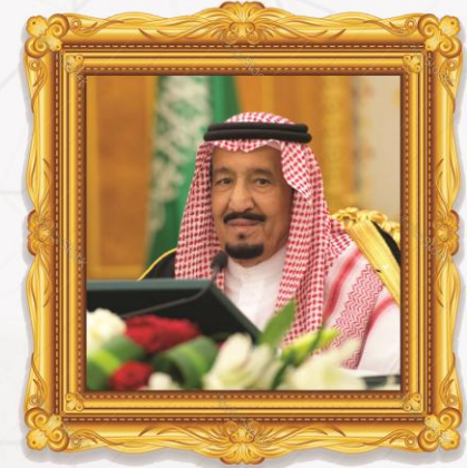
خادم الحرمين الشريفين الملك سلمان بن عبدالعزيز ملك المملكة العربية السعودية