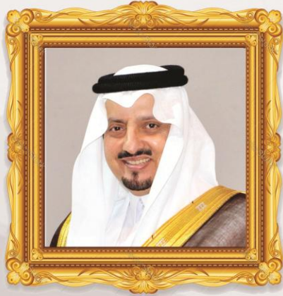
صاحب السمو الملكي الأمير فيصل بن خالد آل سعود أمير منطقة عسير