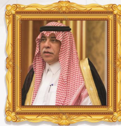
معالي وزير التجارة والاستثمار ماجد بن عبدالله القصبي