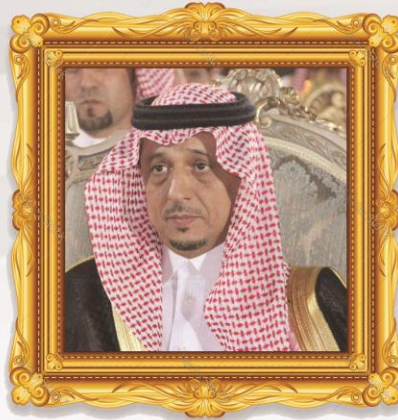
محافظ محافظة بيشة محمد بن سعيد بن سبره