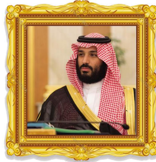
صاحب السمو الملكي الأمير محمد بن سلمان آل سعود ولي العهد ونائب رئيس مجلس الوزراء