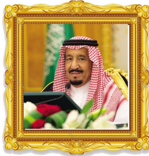
خادم الحرمين الشريفين الملك سلمان بن عبدالعزيز ملك المملكة العربية السعودية