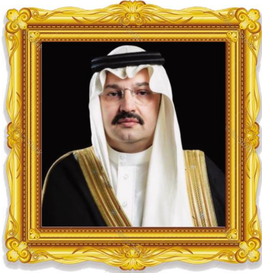
صاحب السمو الملكي الأمير تركي بن طلال آل سعود أمير منطقة عسير